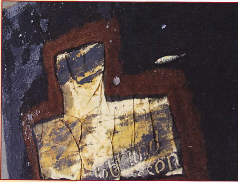
Detail drijvende viltapijten